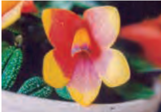
赤と黄色のバイカラー