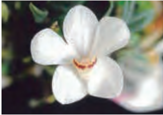
非常に珍しい白の花(希少)