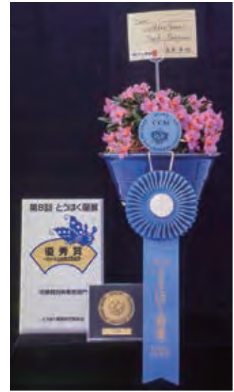
2011年1月 仙台市「夢メッセみやぎ」 準グランプリ

バブアニューギニア島とニューアイルランド島の標高1000m~3000mに自生する着生種。花色は普通赤であるが、オレンジ・ピンク等個体の変化は大きい。主に夏~秋咲きで花もちが6ヶ月を超える。赤道に近い所に着生しているが、標高が高いため、青森でいうと、八甲田山の頂上以上の高さ、高山植物の様で、葉姿は3cm程である。クールタイプで栽培は困難、夏期は10坪の温室の中、2坪を仕切っていて、エアコンを設置し夜は冷房栽培(20℃)している。