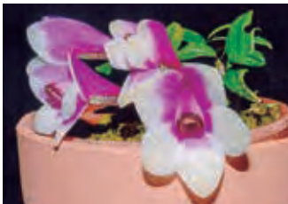
ピンクと白のバイカラー